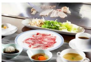
近江牛 焼きしゃぶランチ