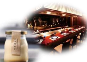
彦根IYUプリンお土産付 高級感漂う特別な空間